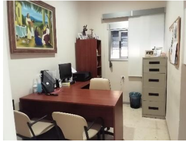
Despacho de la dirección