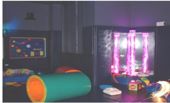
Sala de estimulación sensorial

Cuenta con espacios abiertos y ajardinados adaptados para el desarrollo de actividades educativas, terapéuticas y de ocio, momentos de esparcimiento, así como una barbacoa.