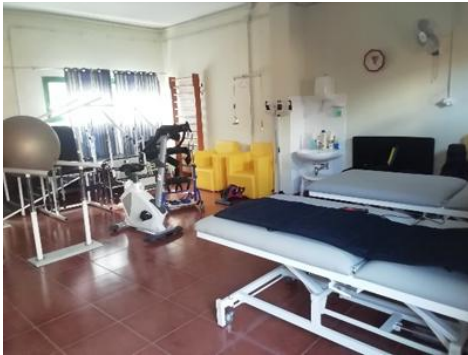
Sala de Fisioterapia

También se encuentran otras áreas de intervención, como sala de fisioterapia y la sala de estimulación sensorial.