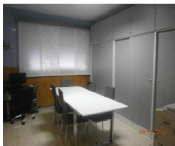
Sala de trabajo