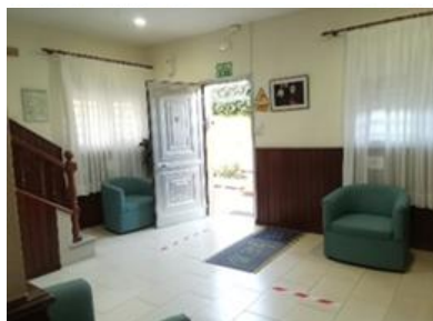
Sala de visitas

El centro se encuentra adaptado con rampas y ascensor. Tiene dos plantas edificadas que se reparten de la siguiente forma: planta principal: sala de visitas, capilla, despacho, cocina-comedor, lavandería, salón de esparcimiento, habitaciones, baños adaptados, despachos, enfermería.