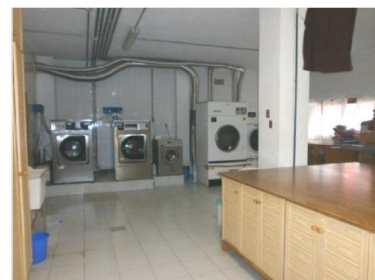
Lavandería y Ropería

También se encuentran otras áreas de intervención, como sala de fisioterapia y la sala de estimulación sensorial.